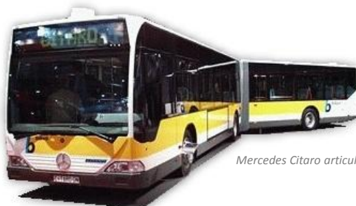
Mercedes Citaro articulé