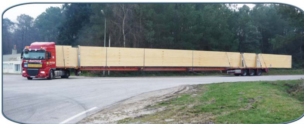
Convoi exceptionnel de 45 mètres.

Etre conscient de l'importance absolue et urgente de participer quotidiennement au respect de notre environnement pour les générations futures, c'est bien. Le mettre en application par une action vraie, c'est mieux !